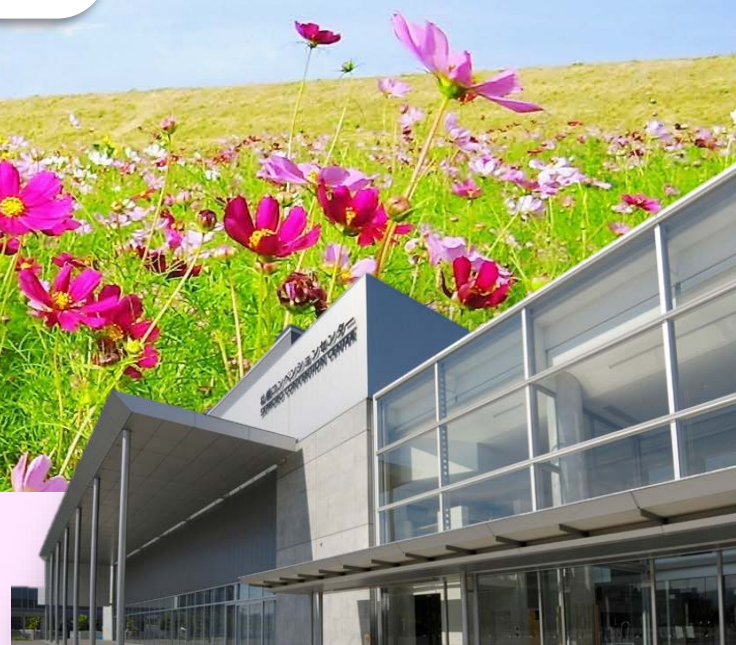
札幌コンベンションセンター

ホームページでは、参加発表要領の他、ランチョンセミナー、展示会、懇親会、託児所、市民講演会(9月28日(日)無料)などご案内しております。皆様、多数のご参加をお待ち申し上げます。