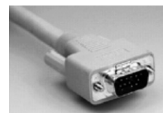
接続ケーブル側（オス）