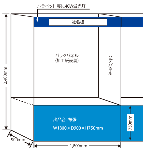
— 小間規格:A、Cタイプ共通 —