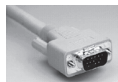
接続ケーブル側（オス）